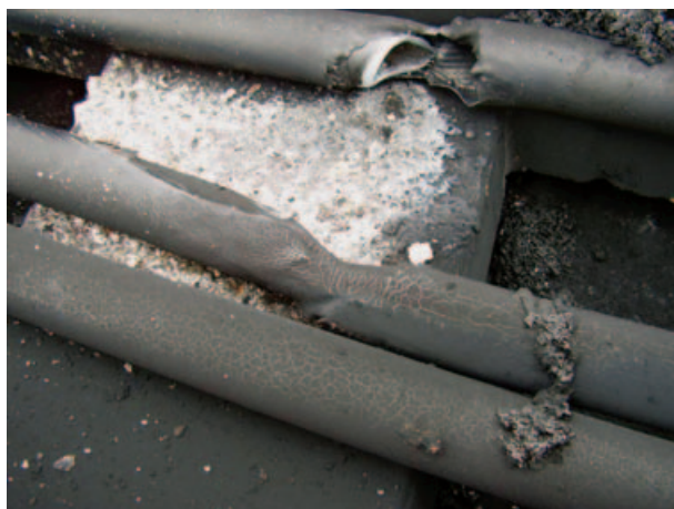
Рис. 1. Повреждение кабеля с изоляцией СПЭ в сети 35 кВ вследствие развития ОЗЗ и его перехода в двухфазное КЗ

жения 35 кВ печной установки [5]: за 1,5 года эксплуатации на шести КЛ длиной по 1200 м каждая в ходе периодических ремонтов с восстановлением пробитого кабеля было установлено дополнительно более 10 муфт.